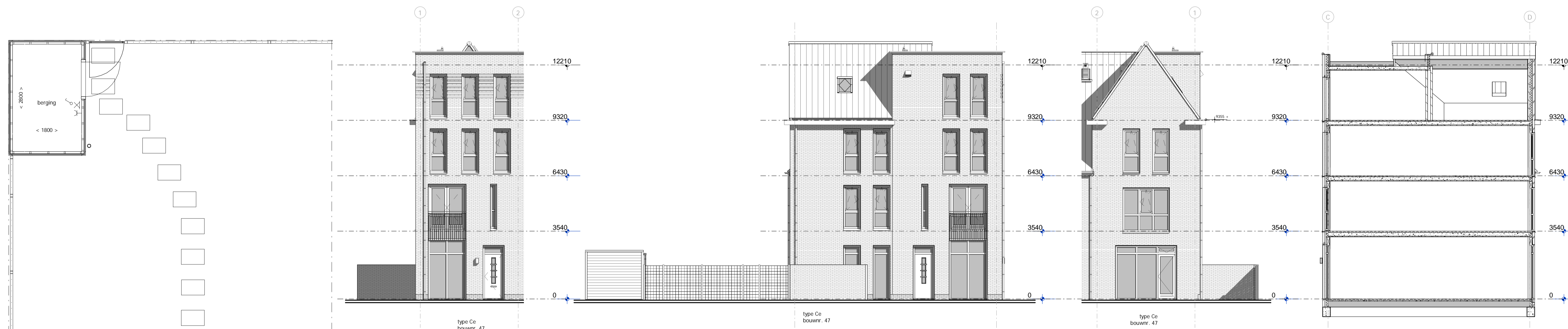
voorgevel linker zijgevel achtergevel Doorsnede principe