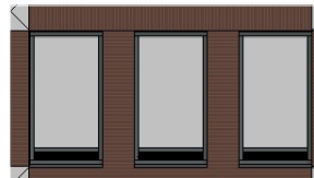
Noord-gevel 1 : 50