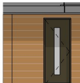
doorsnede A 1 : 50