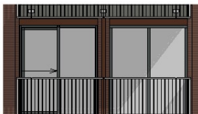
Zuid-gevel 1 : 50