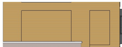
Zuid-gevel 1 : 50