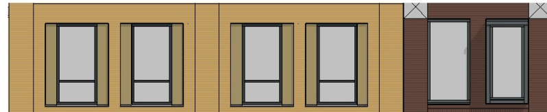
Oost-gevel 1 : 50