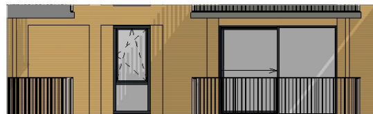
West binnengevel 1 : 50